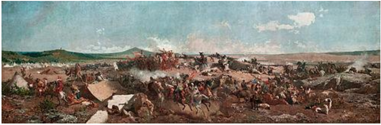
Batalla de Tetuán de Marià Fortuny. Museo Nacional de Arte de Catalunya