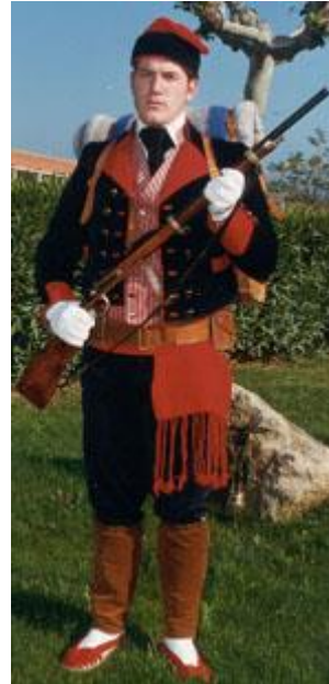
Voluntario catalán con uniforme de gala