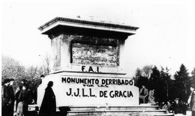
Estatua ecuestre de Prim derribada por la FAI.