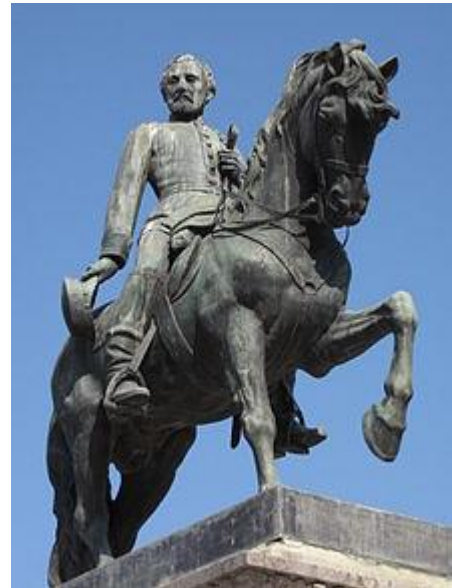
Plaza del Mercadal. Reus